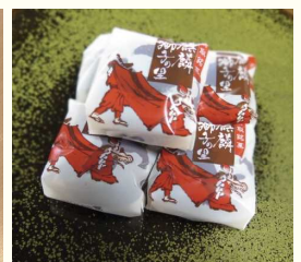
オレンジピール入り白あんをチョコ生地で包んであり、お茶にもコーヒーにもぴったり。