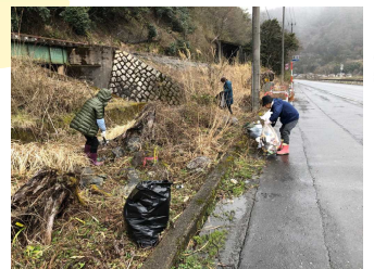
清掃するメンバー

先日、観光列車若桜号デビュー前に沿線を見きれいにしようということで、メンバー数名とゴミ拾いをしました。