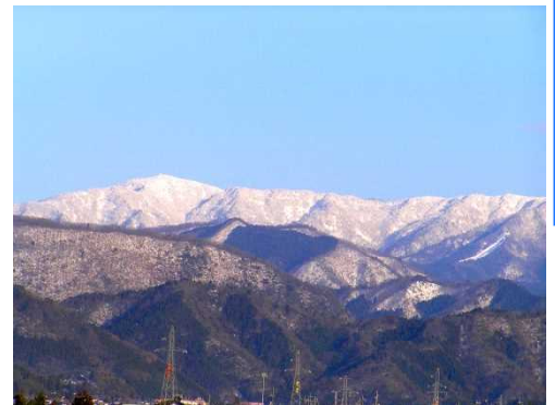
横田から眺める雪の氷ノ山

八東駅の右手方には、山頂まで登山道が整備された伊呂宇山があり、広大な松林を通り登頂できる。