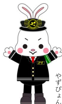
八頭町マスコットキャラクター「やぶぽよん」

住所：八頭郡八頭町西谷564-1 船岡竹林公園内 営業時間：博物館 9:00-17:00 乗車体験 10:00-15:00 開館：3月1日～11月30日 (12月～2月末は閉館) 休館：毎週水曜日 (祝日の場合は翌日) 料金：大人(高校生以上) 200円/小人(中学生以下)無料 団体割引 (20人以上) 大人 160円 障がい者・障がい者介助者は無料 若桜鉄道利用して来場され、降車証明書持参の場合は無料