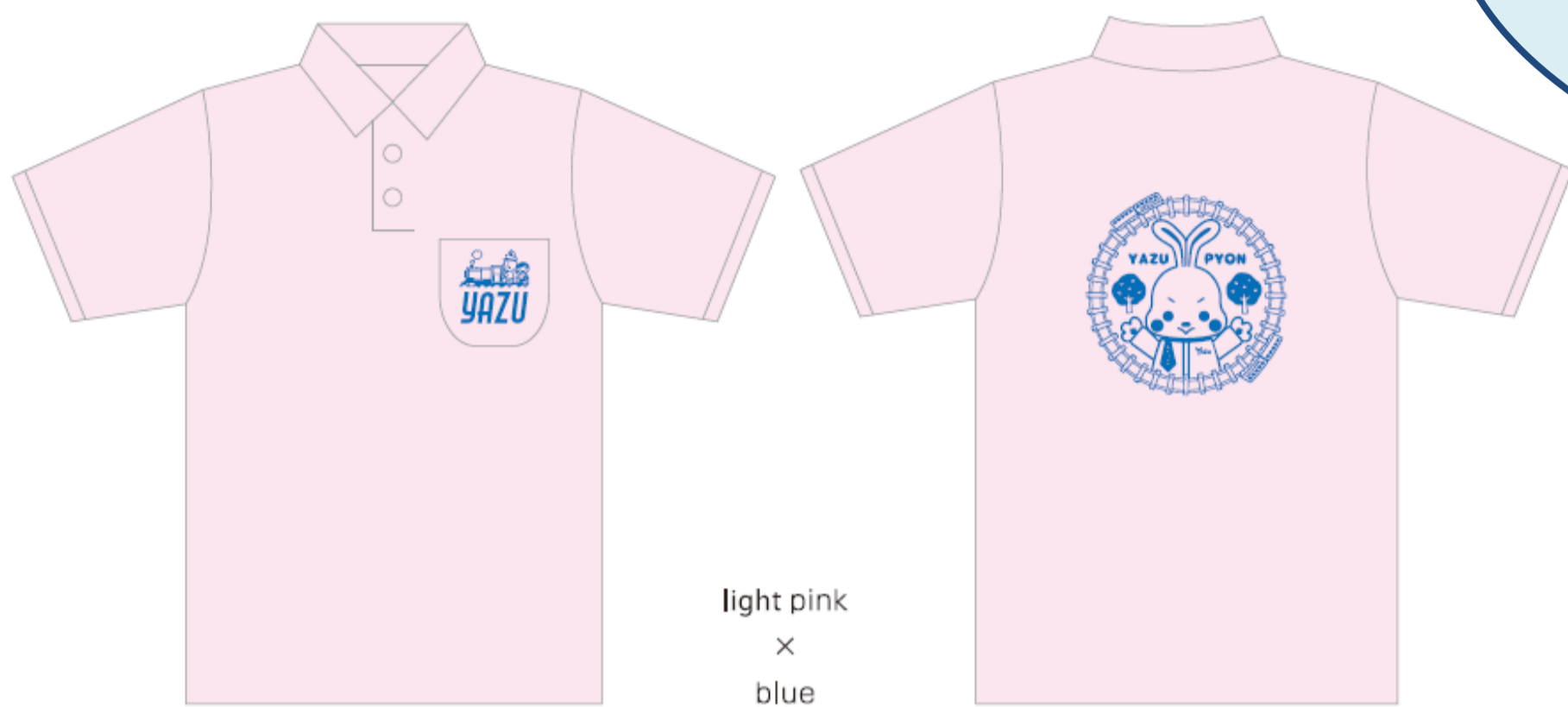
light pink × blue

今年度は、やすびよんの周りに若桜鉄道の線路と列車、そして柿と梨の木をデザインしました。これは昨年度行った公募デザインの中で、保育所の先生方と園児の皆さんと一緒に考えたデザインを基に構成しています。カラーは人気の12色の中からお選び頂けます。