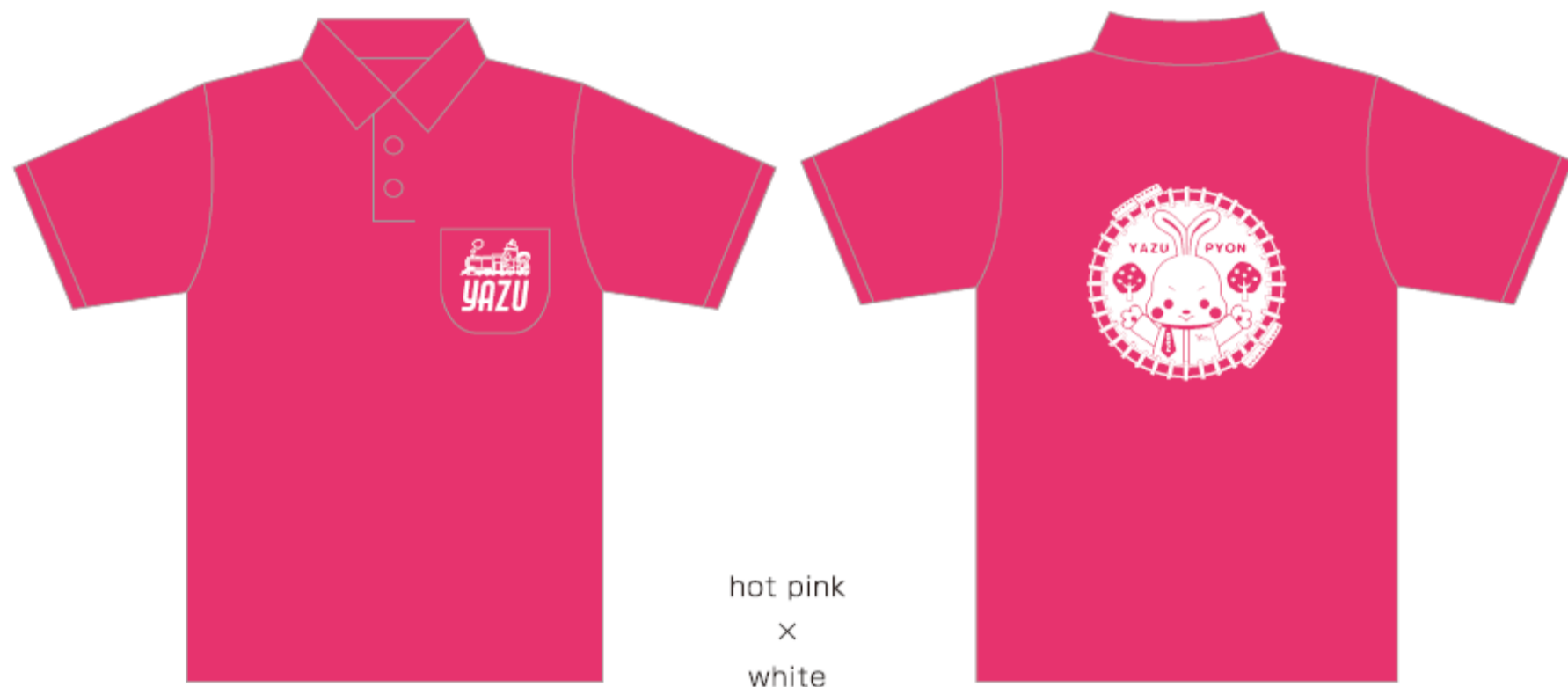
hot pink × white