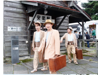
津山、松江からゲストでやってきた3人のなまりきり寅さんたち。楽しいパフォーマンスに会場が沸きました