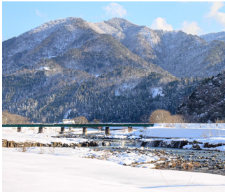
とっておきの写真をどうぞ

若桜町観光協会と八頭町観光協会が主催する写真コンテストの作品募集中です。今回は「冬」がテーマ。列車、線路、駅舎など若桜鉄道に関する素材が映っていればOK。応募条件等、詳しくは両町観光協会に置いてあるチラシ、またはホームページをご覧ください。締め切りは2月28日（金）必着です。