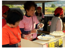
ふるまい団子を準備するもりあげ隊メンバー