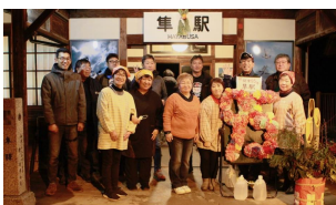
隼駅を守る会、隼守倶楽部、隼ONDのメンバーが集まりにぎやかな年越しでした！

隼駅は1月20日で開業95年。大晦日から新年にかけて、記念すべき年の始めを隼駅で迎えお祝いしようと、ミニイベントを行いました。開業100年まであと5年！カウントダウンではなく、カウントアップしながら盛り上げていけたらと思います。来年も開催しますのでみんな来てね！