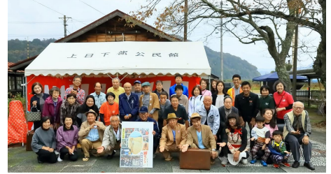
上日下部のみなさんともりあげ隊メンバー、関係者一同で集合写真。いい笑顔です