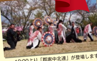
18:00より「郡家中北連」が登場します!

※27日(日)13時~22時はイベント会場になるため、因幡船岡駅前駐車場がご利用できません。お車の方は「トスクるふなおか」の駐車場をご利用ください。