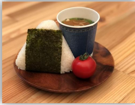
◆おにぎりセット 500円