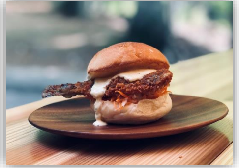
◆ヤマメバーガー 500円