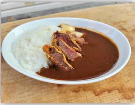
◆鹿肉のカツカレー 1000円

夜には「 バー・オウル・ナイト 」として、カフェからバーに変わります。八東ふる里の森でしか飲めない厳選仕入れのお酒もお楽しみいただけます。