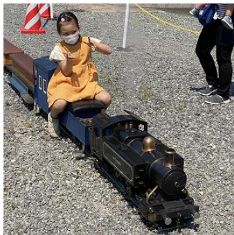
津山市遠征時の風景

OS・T5スーパーは、小川精機社（模 型用エンジン製造会社）が製造・販売して いたライブスチーム（模型用蒸気機関車） の製品で、小川精機オリジナルの自由形 （C形）が特徴、当時は価格も手ごろで人 気の車両と聞いています。現在、ライブス チームの販売は中止され、今は貴重な車両 のひとつです。 当博物館では、 小型で取り扱い やすいことから 乗車体験運転会 の初任機関士向 けの車両として 長く活躍してい ます。