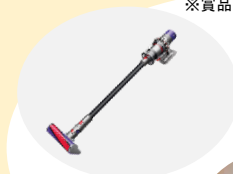
Dyson Cyclone V10