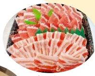
オンリーBooの しゃぶしゃぶセット