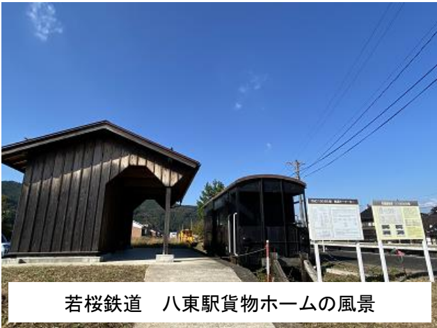
若桜鉄道 八東駅貨物ホームの風景

八東駅貨物ホーム復元計画の新たな車両にふれておいただきますよう若桜鉄道八東駅にお立ち寄りください。