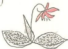
うさぎの咲く花が美しい...