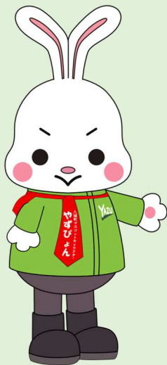
八頭町マスコットキャラクター やすびよん

時間 10:30~12:30 定員 20名(事前申込制) 参加費 無料 申込先 船岡竹林公園 (TEL 0858-73-8100)