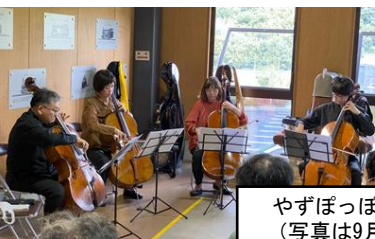
やずっぽぼコンサート （写真は9月開催予定）