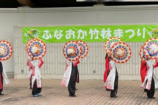
ふなおか竹林まつりステージ