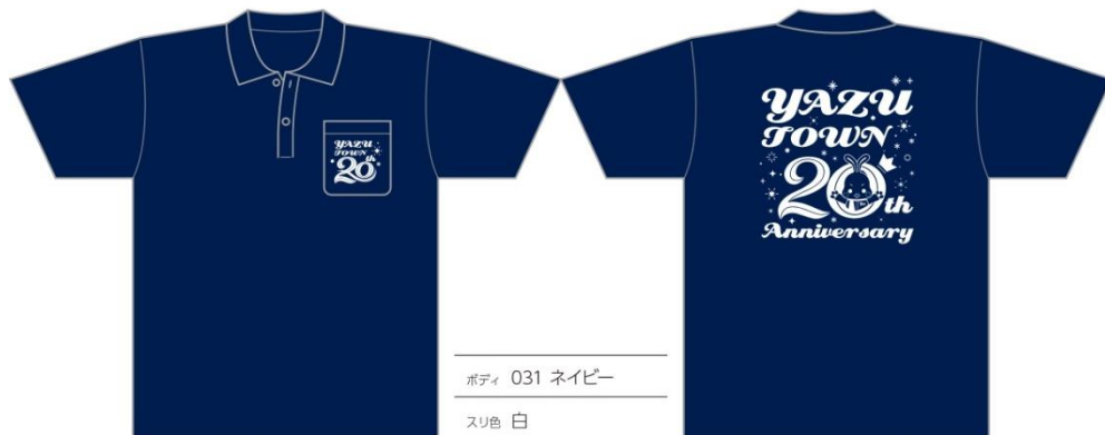
ボディ 031 ネイビー スリ色 白