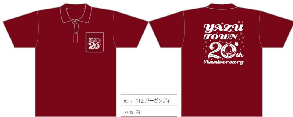
ボディ 112 バーガンディ スリ色 白