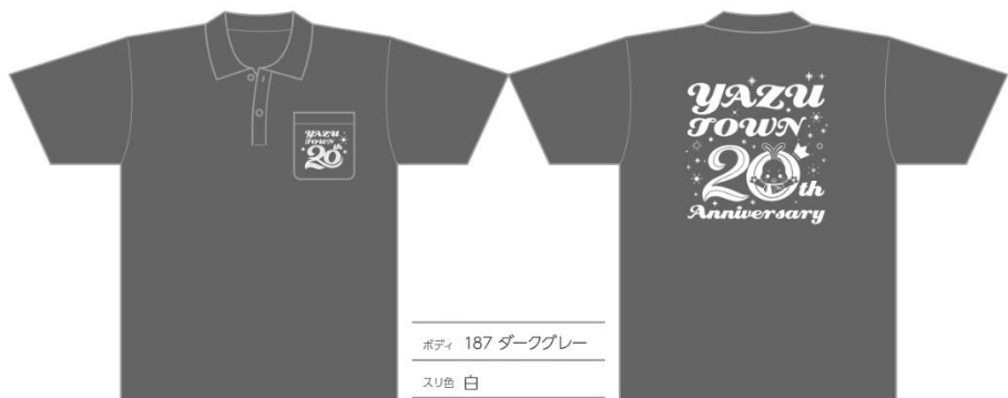
ボディ 187 ダークグレー スリ色 白