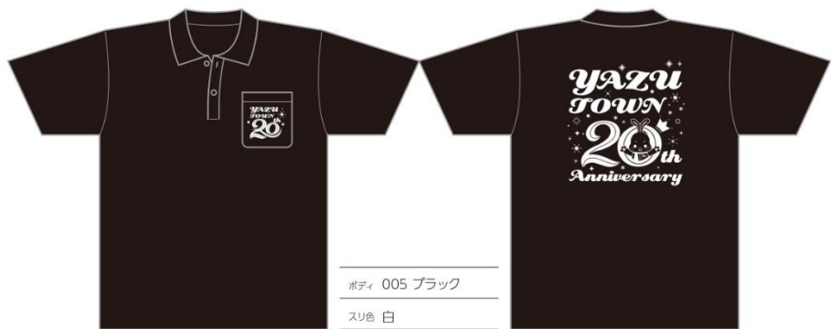
ボディ 005 ブラック スリ色 白