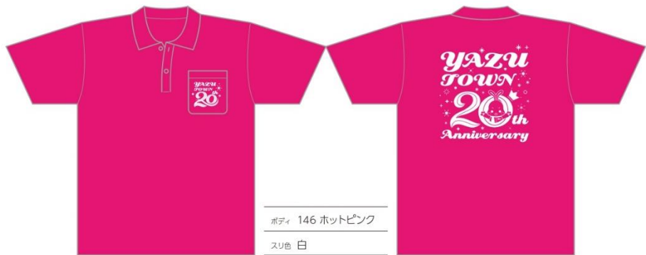
ボディ 146 ホットピンク スリ色 白

色、形はイラストと現物では若干異なりますので、あくまで刷り色の参考としてご覧ください。