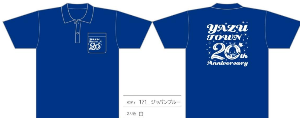
ボディ 171 ジャパンブルー スリ色 白