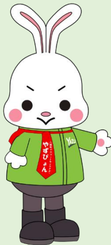
八頭町マスコットキャラクター やずびん